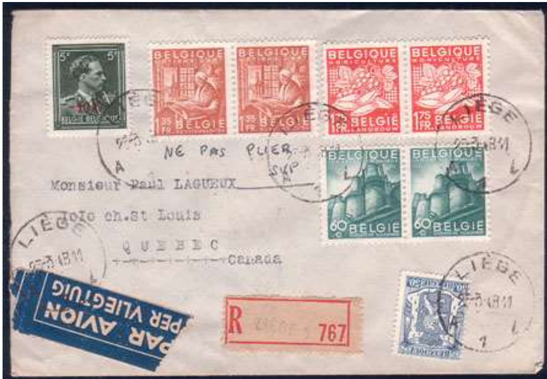
Lettre de Liège vers Québec (Canada) - ??/03/1948