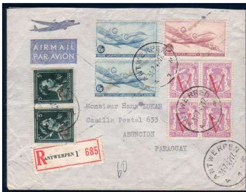
Lettre du 31/07/1947 d'Antwerpen à destination d'Asuncion (Paraguay)