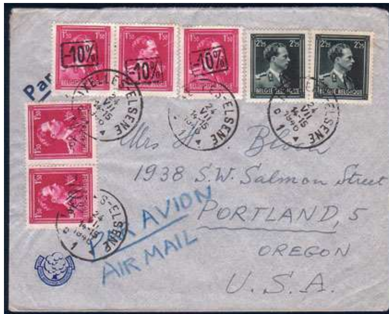
Lettre d'Ixelles vers Oregon (USA) – 24/07/1946