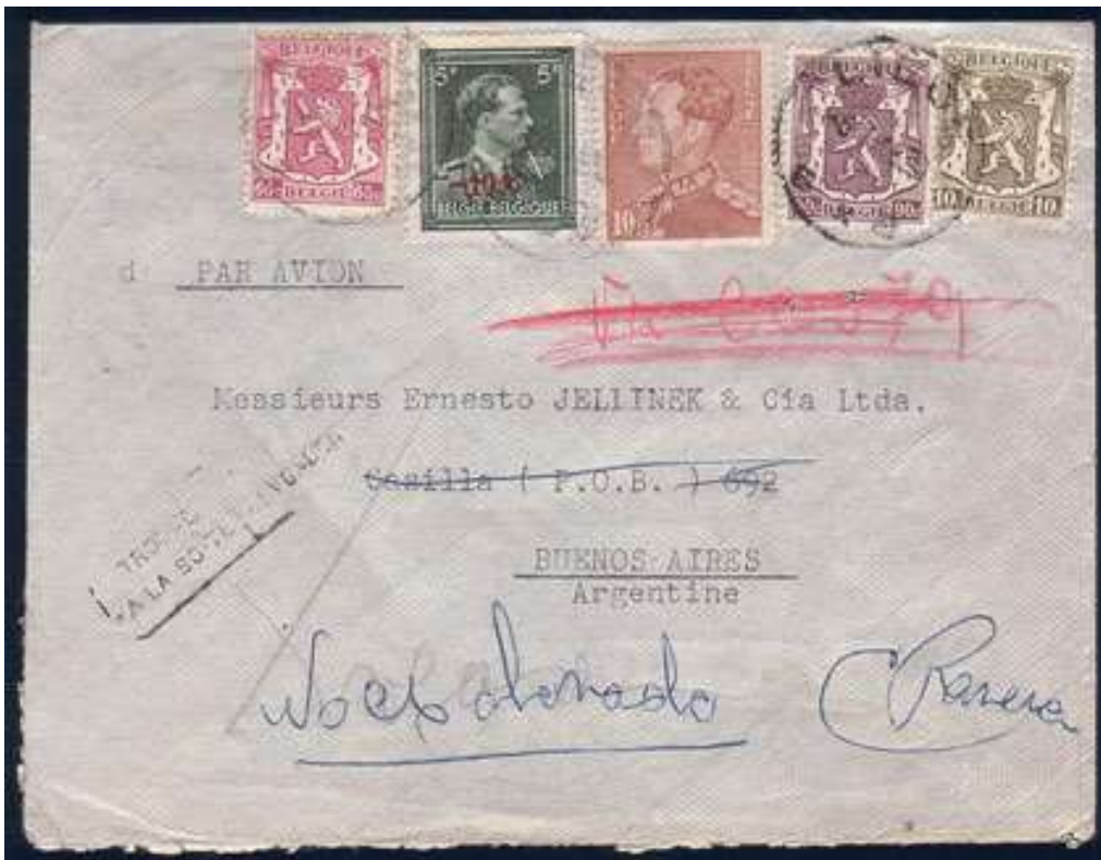
Lettre de Liège vers Buenos Aires (Argentine)