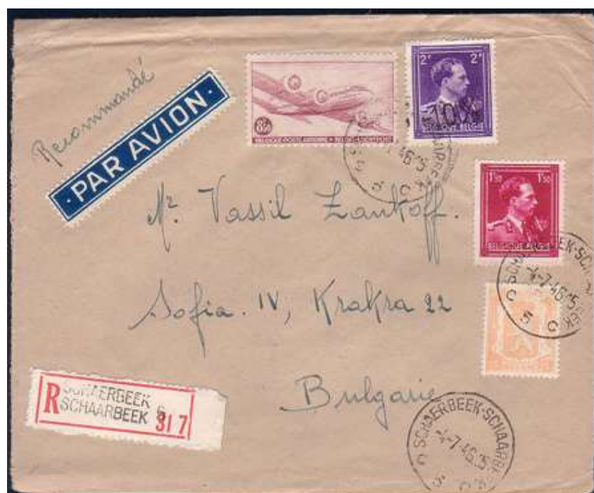
Lettre de Schaerbeek vers Sofia (Bulgarie) – 04/04/1946