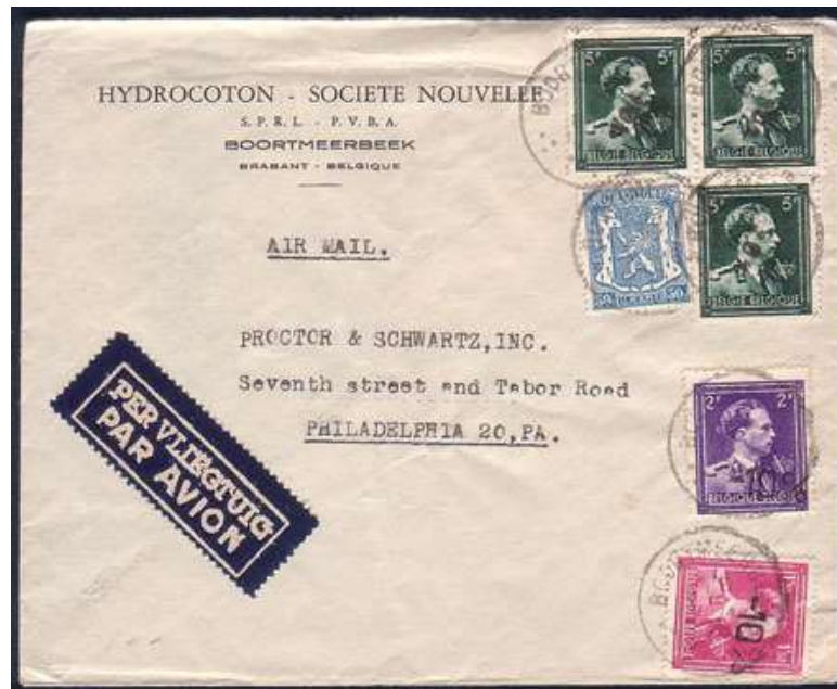
Lettre à destination de Philadelphia