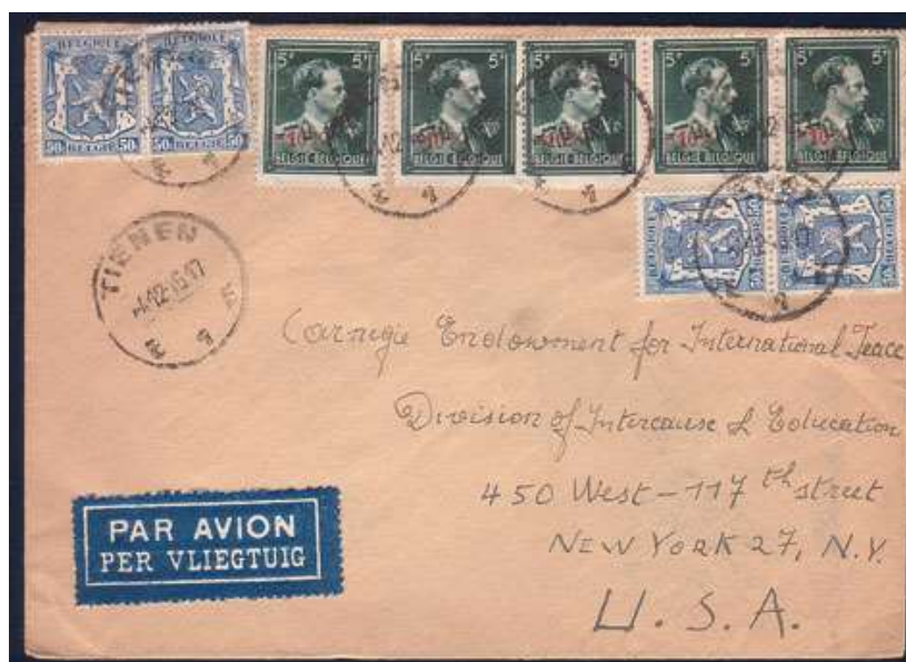
Lettre de Tienen à destination de New York