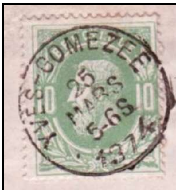
Cachet à date d'Yves-Gomezée du 25/03/1874 Bureau de perception ouvert le 15/03/1874

Agréation n° P501051 Mensuel (sauf juillet et août) Bureau de poste : PHILIPPEVILLE Septembre 2020 N° 329