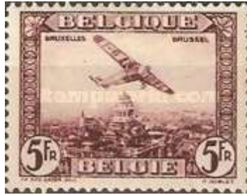
Avion FOKKER F.VII

Dès 1931 , un périple de reconnaissance avait été effectué par la SABENA en vue de l'implantation de la ligne . Cette reconnaissance avait été entreprise au moyen d'un trimoteur FOKKER F.VII , type d'appareil à l'aide duquel allait être réalisée la première liaison régulière .