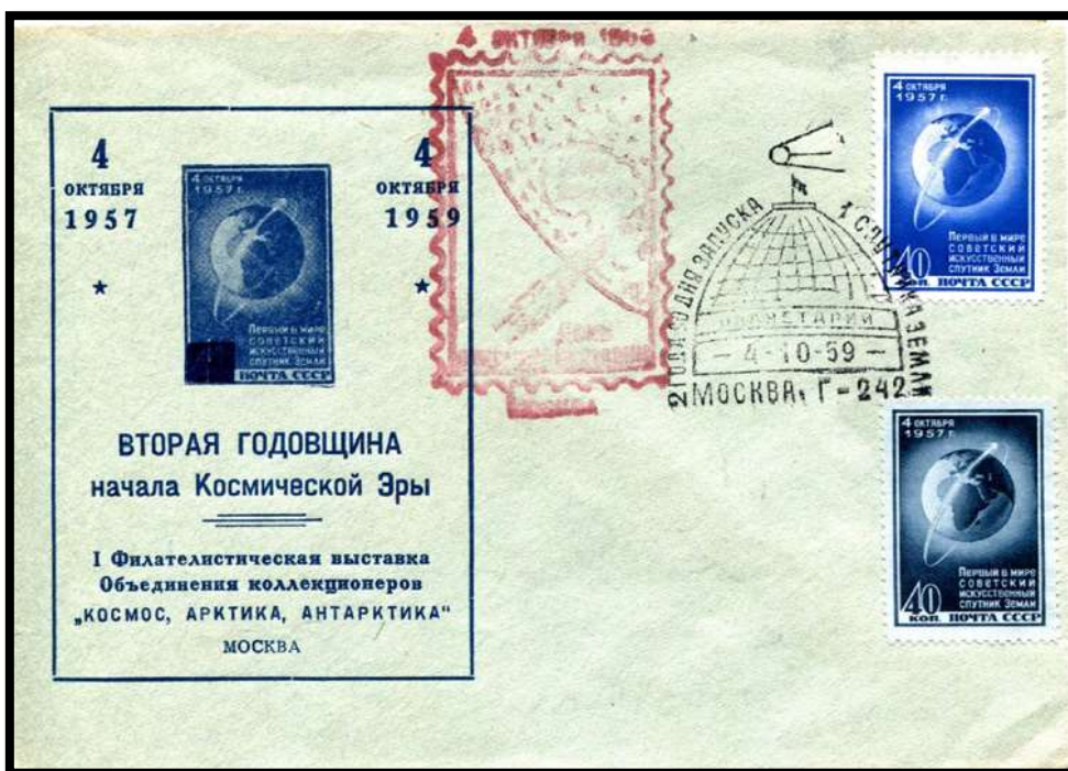
Pli du 2 ème anniversaire avec oblitération spéciale de moscou , plusieurs présentations existent

Mes documents sur ce thème sont très nombreux et variés , accumulés depuis plus de 50 ans : mon choix s'est porté sur du matériel soviétique émis pour des anniversaires . Comme la réussite du lancement n'était pas assurée , aucune oblitération du jour du lancement n'existe (à ma connaissance) , mais des cachets ont pu être apposés bien après .