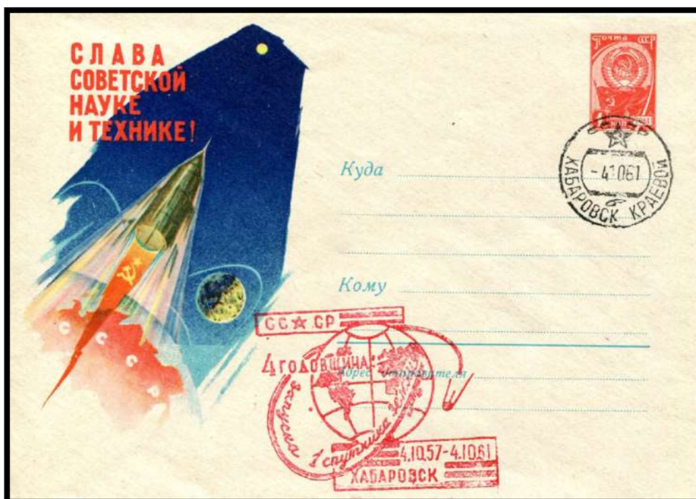
4 ème anniversaire : oblitération de Khabarovsk du 04/10/1961 sur entier postal