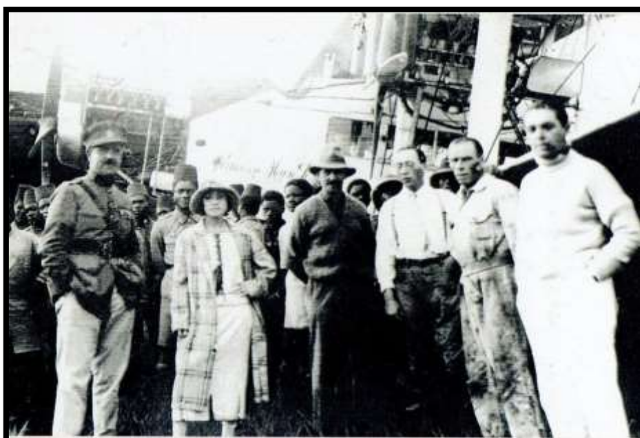
L'arrivée à Léopoldville