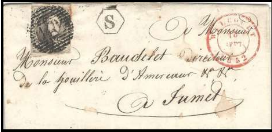
Lettre expédiée de Walcourt à destination de Jumet Cachet à date de Walcourt du 18/09/1852 Cachet de boîte hexagone