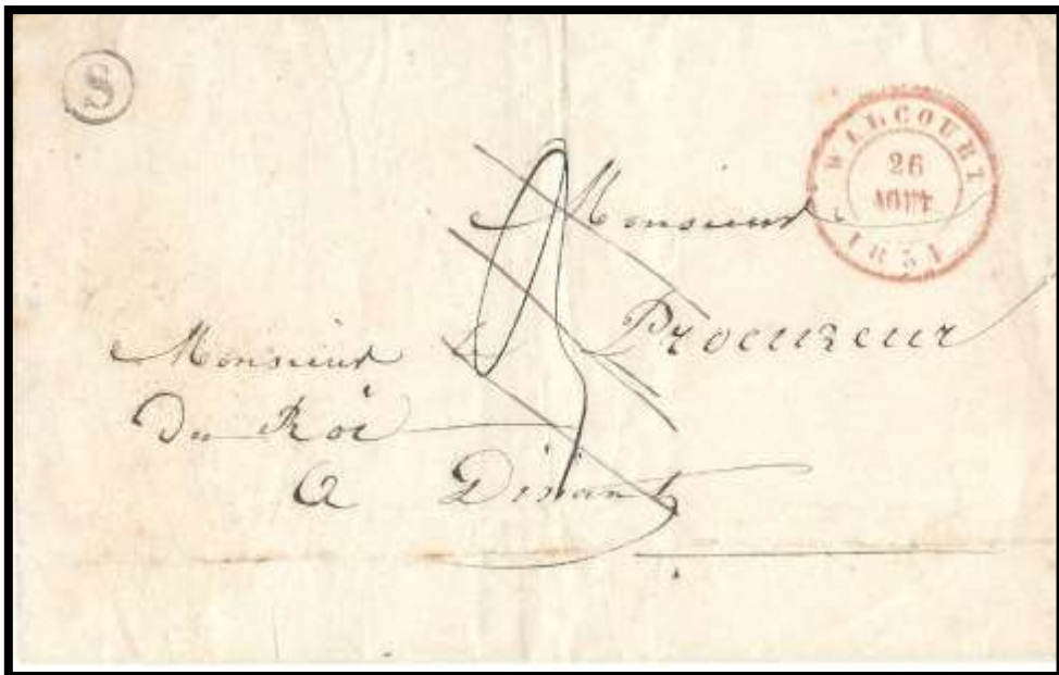
Lettre expédiée de Walcourt à destination de Dinant Cachet à date de Walcourt du 26/08/1854 Cercle de boîte de 9 mm