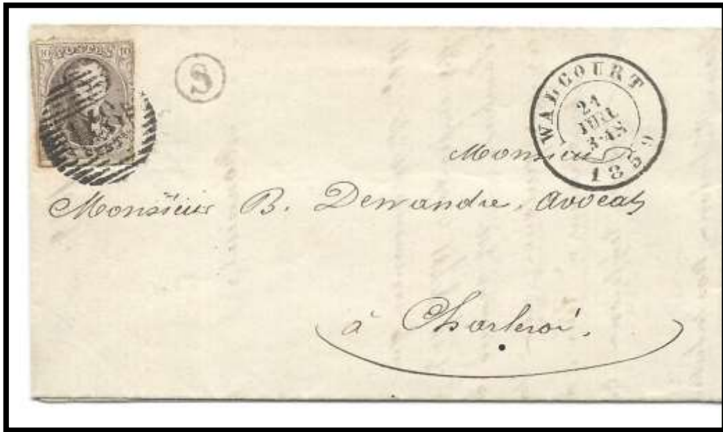
Lettre expédiée de Walcourt à destination de Charleroi Cachet à date de Walcourt du 21/07/1859 Cercle de boîte de 9 mm