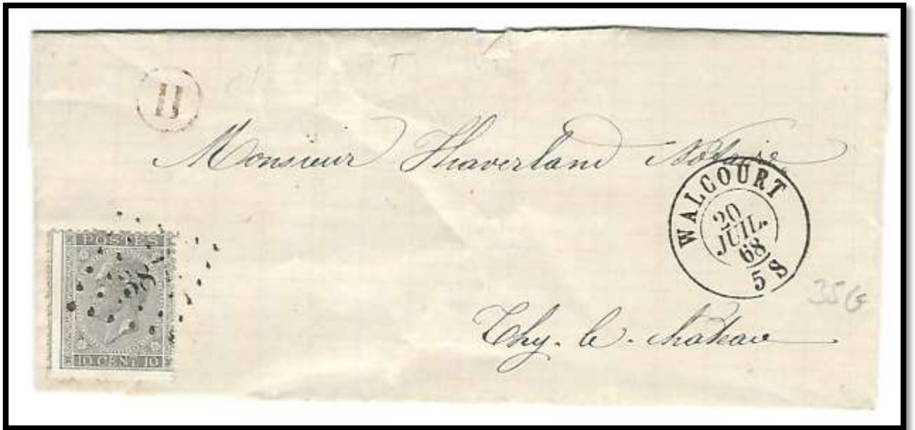
Lettre levée à Clermont – Cachet de boîte rurale "H" . Lettre expédiée de Walcourt le 20/07/1868 (5 S) à destination de Thy-le-Château . Au verso , cachet à date de Walcourt du 20/07/1868 (5 S) . Port appliqué de 10 centimes (tarif du 01/05/1868 au 31/05/1870) . Calcul : 10 centimes (jusqu'à 30 km) x 1 port (poids de 0 à 15g) = 10 centimes .