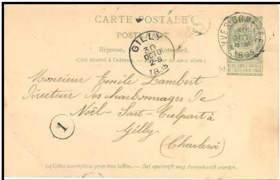
Carte postale expédiée d'Yves-Gomezée à destination de Gilly Cachet à date d'Yves-Gomezée du 30/10/1895 Cercle de boîte de 12 mm