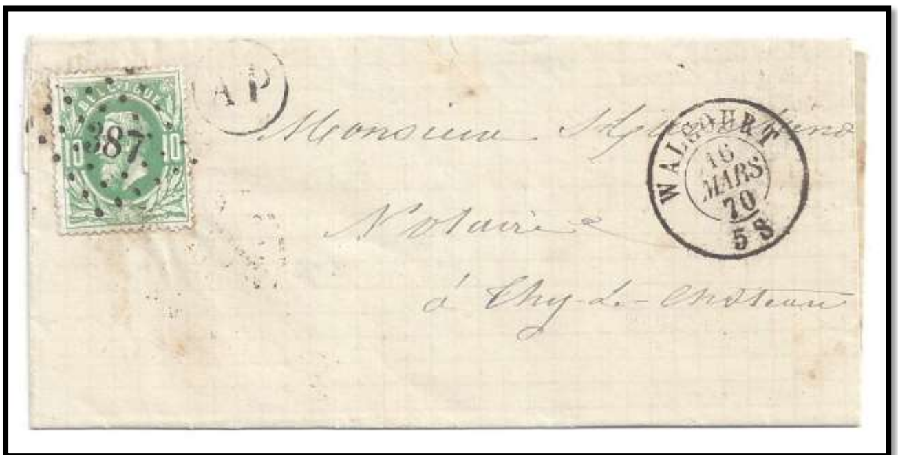
Lettre levée à Castillon – Cachet de boîte rurale "AP" . Lettre expédiée de Walcourt le 16/03/1870 à destination de Thy-le-Château . Port appliqué de 10 centimes (tarif du 01/05/1868 au 31/05/1870) . Calcul : 10 centimes (jusqu'à 30 km) x 1 port (poids de 0 à 15g) = 10 centimes .