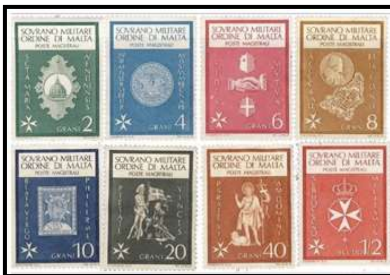
Ordre de Malte 1966 , 8 des 9 premières vignettes émises par l'Ordre

En temps qu'Ordre Souverain , l'Ordre de Malte peut , au même titre que les autres états , frapper sa monnaie et émettre ses propres timbres . La première émission date du 15/11/1966 et est constituée d'un ensemble de 9 vignettes bicolores assez basiques mettant