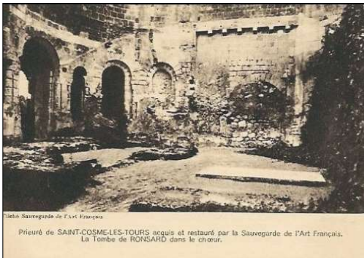
CP Priuré de Saint-Cosme-Les-Tours