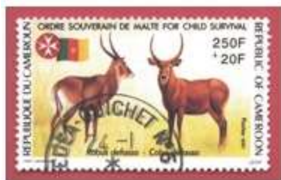
Cameroun 1991 , Ordre Souverain de Malte for child survival