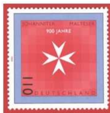
Allemagne en 1999 , hommage à l'Ordre de Malte