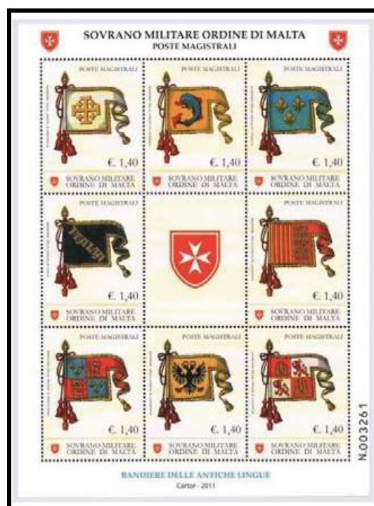
Ordre de Malte 2011 , Bandiere delle antiche lingue

En 1798 , Napoléon BONAPARTE attaque et s'empare de Malte . L'Ordre est chassé et ère en Italie . Il s'installera officiellement à Rome en 1834 où il possède le Palais Magistral ainsi que la Villa Magistrale sur le mont Aventin . Ces deux possessions ont la "garantie d'extraterritorialité" . Cela implique que l'Ordre de Malte ne dépend que de ses propres règles et non celles de l'Italie sur ce territoire .