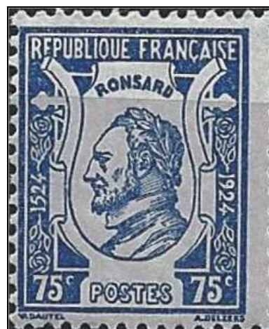
France 1924 , timbre de 75 cts à l'effigie de Ronsard

Nos amis de Phil-Ouest ont apporté la réponse au pourquoi de cette démonétisation rapide :