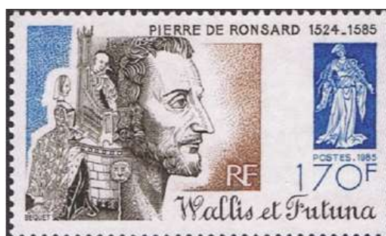
Wallis et Futuna 1985 , timbre de 170 Francs Pacifiques "Ronsard"