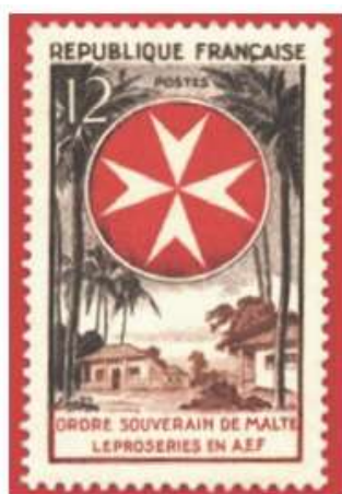
France 1956 , soutien aux léproseries en AEF

Au-delà de l'Ordre lui-même , d'autres pays lui rendent hommage en émettant des timbres à son effigie . Ainsi , l'Allemagne , la Roumanie , le Cameroun , la Gambie et bien d'autres dont le Vatican ont émis des timbres reprenant la célèbre croix de Malte .