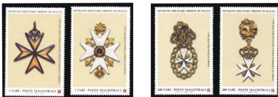
Ordre de Malte 2004 , insignes de chevaliers

Il y a au sein de l'Ordre de Malte énormément de personnes qui travaillent . Certaines sont rémunérées , mais la plupart sont bénévoles , très utiles sur le terrain .