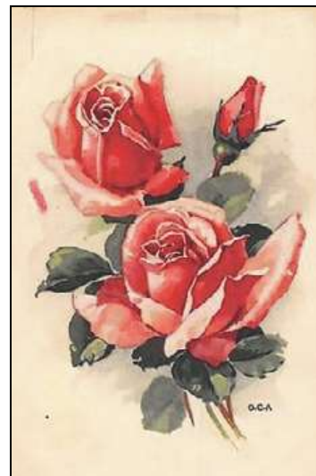
CP représentant des roses chères à Ronsard