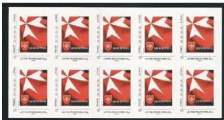
France , bloc de 10 timbres à l'effigie de la croix de Malte

L'Ordre de Malte est encore à ce jour le seul Ordre reconnu par le Vatican qui ne lui appartient pas .