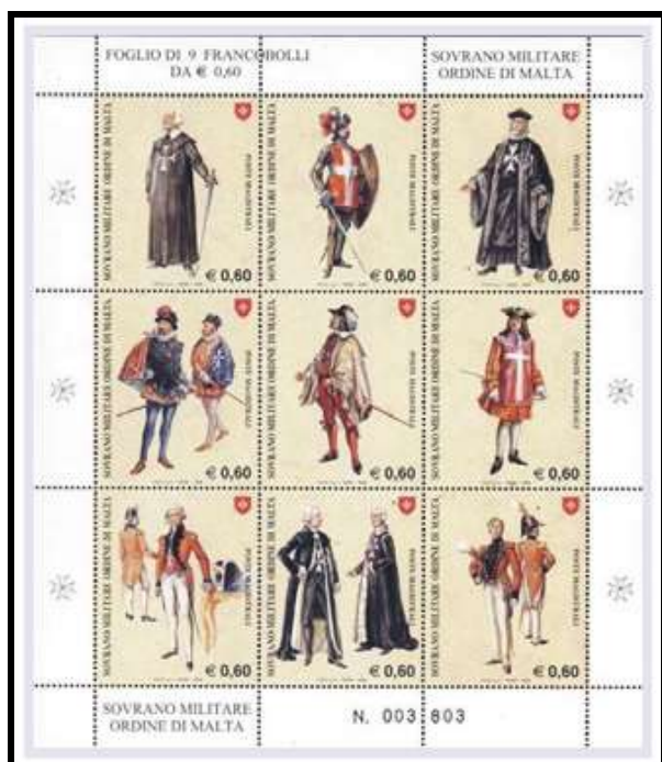
Ordre de Malte 2008 , Foglio di 9 francobolli

L'Ordre est souverain de Malte . Il dispose d'une armée , d'une flotte , gère son île et chasse le pirate en Méditerranée .