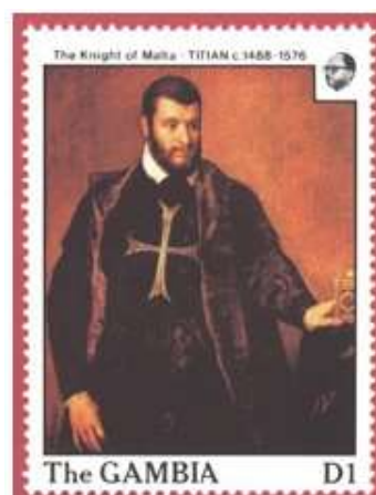
Gambie 1988 , commémoration peintures de Titan , chevalier de l'Ordre de Malte