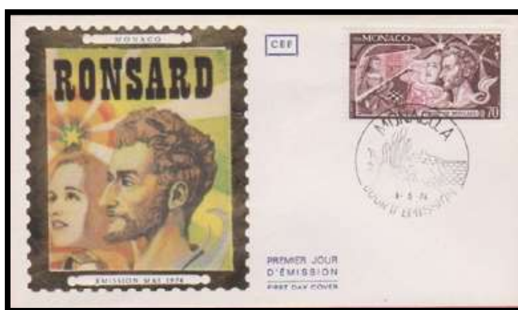
Monaco 1974 , FDC créé à l'occasion de la sortie du timbre de 70 centimes "Ronsard" – Oblitération première émission du 08/05/1974

Wallis et Futuna , l'archipel d'outre-mer français , lui consacre un joli timbre de 170 Francs Pacifiques à l'occasion des 400 ans de son décès .