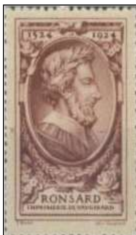
France 1924 , vignette à l'effigie de Ronsard