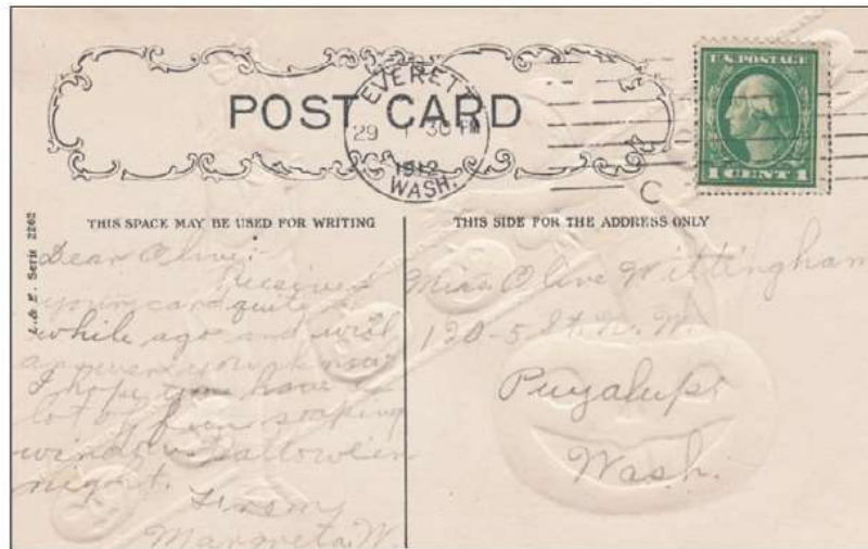
USA 1912 , CPA gaufrée sur la thématique d'Halloween

Depuis quelques années , on nous rabâche les oreilles avec le célèbre "il ne faut pas fêter Halloween , c'est une fête commerciale américaine !" . Il est vrai qu'Halloween s'est imposé depuis les années '90 dans nos pays francophones d'Europe et que le business autour de cette fête est florissant . Mais saviez-vous qu'en fait Halloween ne nous vient pas de si loin ?