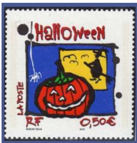
France 2004 , timbre dessiné Halloween Jack-o'-Lantern