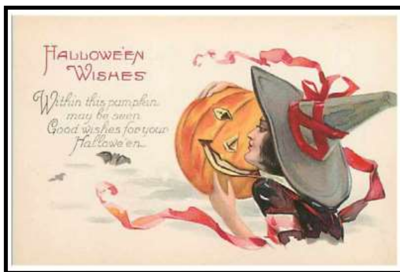
CPA décorée Halloween

Il faut cependant reconnaître que si Halloween est ce qu'elle est dans nos pays aujourd'hui , c'est grâce à nos voisins d'Outre-Atlantique . Halloween est extrêmement populaire aussi bien aux Etats-Unis qu'au Canada et il est certain que c'est ce qui a influencé la jeune génération . Feuilletons et films américains populaires nous ont fait connaître cette fête qui s'est relativement vite imposée dans nos pays .