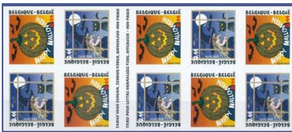
Belgique 2004 , carnet auto-adhésif Halloween

Comme toute grande fête , Halloween est reprise par la philatélie . Il va de soi que les premiers timbres ou flammes dédiés à Halloween viennent du monde anglophone . Dès les années '30 , des flammes portant une citrouille sont apparues . Si aujourd'hui il existe beaucoup de timbres sur la thématique d'Halloween , ils sont relativement récents . En 2004 , La Poste française a émis un timbre représentant Jack-o'-Lantern . Ce timbre connaît certaines variétés de couleur lui permettant d'atteindre un prix important .