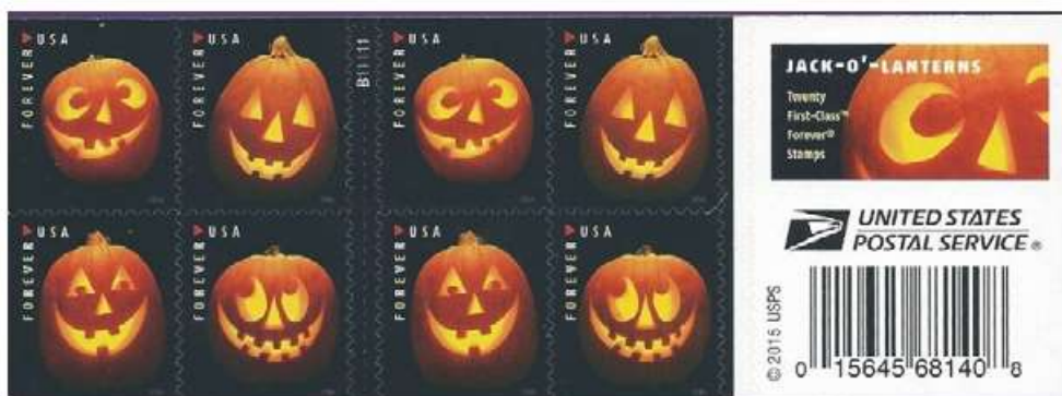
USA 2016 , carnet de timbres autoadhésifs dédié à Jack-o'-Lantern