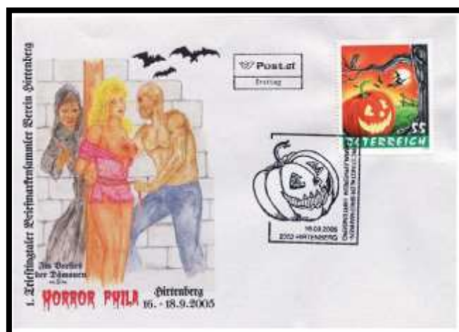
Autriche 2005 , enveloppe 1 er jour spéciale Halloween , oblitération du 16/09/2005