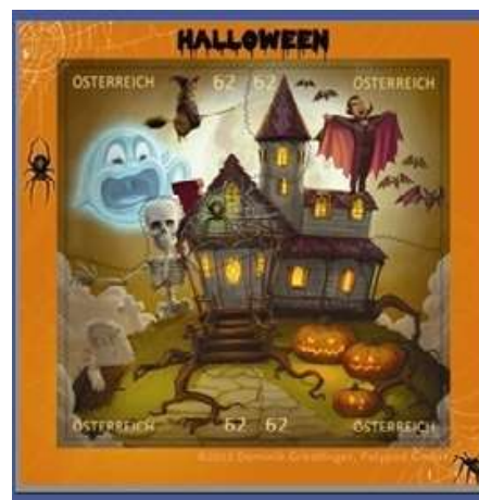
Autriche 2013 , timbre dessiné Halloween