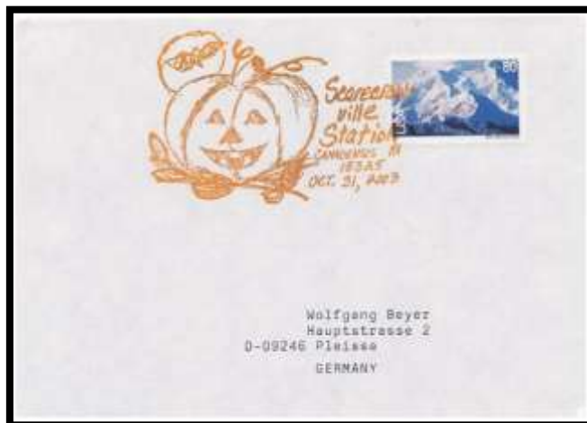
Allemagne 2003 , enveloppe portant une flamme Halloween

Lorsque Jack mourut , le diable ne réclama pas son âme comme prévu ; toutefois , c'était un homme mauvais , il ne put donc pas entrer au paradis . c'est ainsi qu'il est condamné à errer , une lanterne sculptée dans un navet (ou une citrouille) à la main , pour l'éternité !