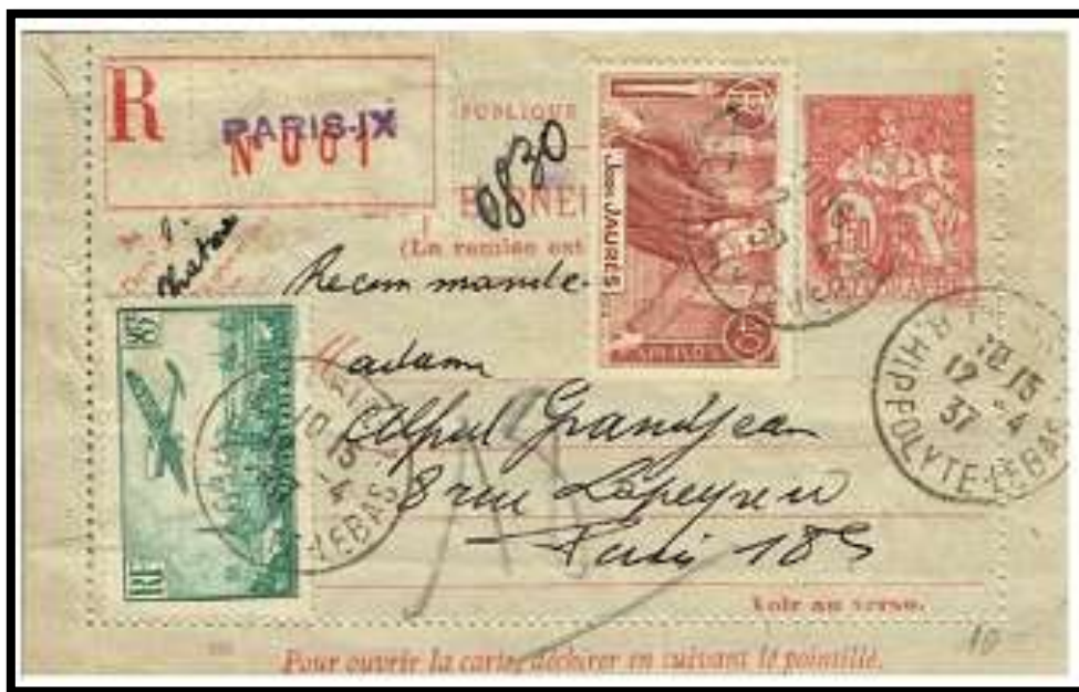
Figure 1 – Pneumatique recommandé du 12/04/1937 , premier jour du service

La possibilité de recommander les pneumatiques a été ouverte à partir du 12/04/1937 (figure 1) en application du décret du 26/03 de la même année . Les pneumatiques recommandés sont peu courants .