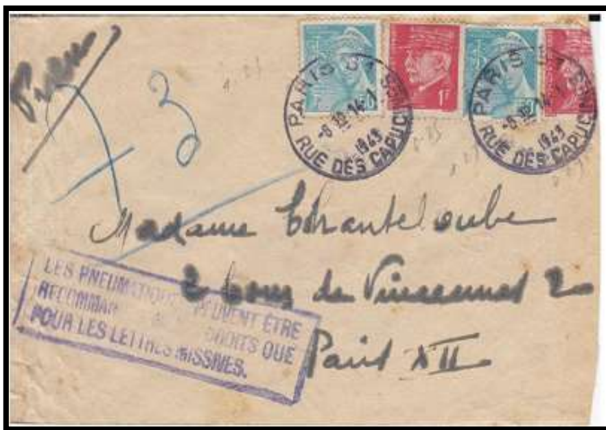
Figure 3 – Marque au "type 7" de Paris 81 , le 14/01/1943

Les cinq derniers types , rares , présentent un agencement particulier du texte , comme le "type 7" qui utilisé à Paris 81 – rue des Capucines (figure 3) ou le "type 8" utilisé à Saint-Denis-sur-Seine (figure 4) , ou bien une police de caractères particulières , comme le "type 12" utilisé à Paris 83 – rue Bleue (figure 5) .