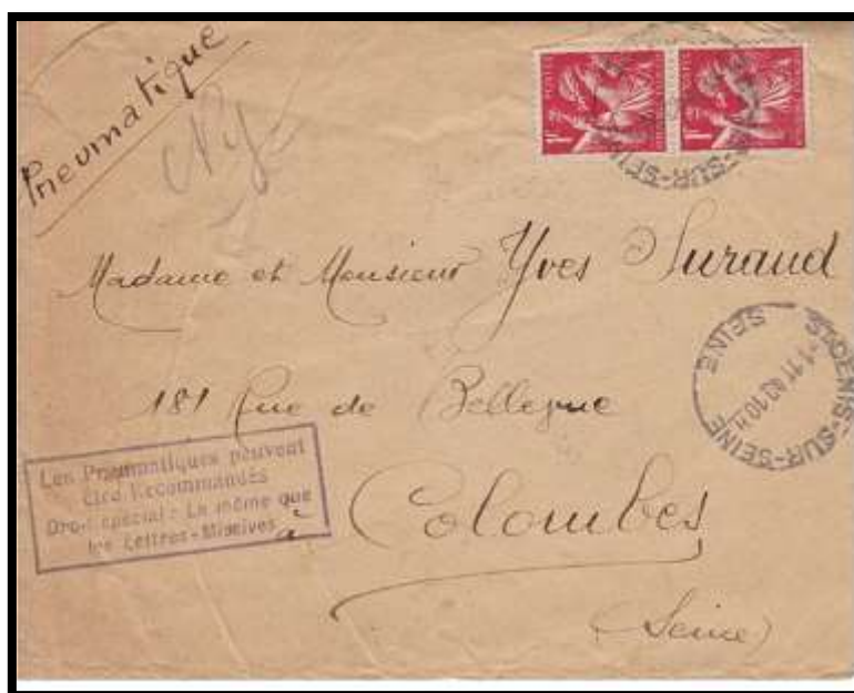
Figure 4 – Marque au "type 8" de Saint-Denis-sur-Seine , le 01/11/1942