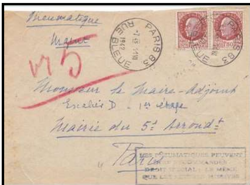
Figure 5 – Marque au "type 12" de Paris 83 , le 11/07/1942

On ne connaît pas de marque après mars 1945 . Sans le secours de textes , on peut imaginer que l'Administration des Postes a considéré que le faible recours à la recommandation des pneumatiques ne justifiait pas l'entretien et le renouvellement du matériel nécessaire à cette promotion .