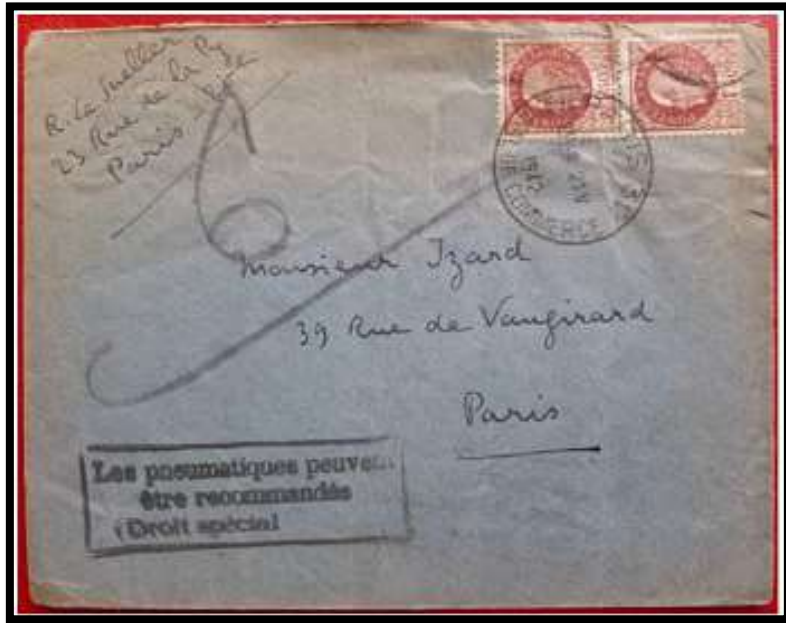
Figure 2 – Marque au type 1 avec valeur grattée , à Paris 32 , le 21/05/1942

Trois types plus rares ne se distinguent des types courants que par la taille de la marque .