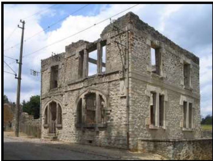
Le bureau de poste