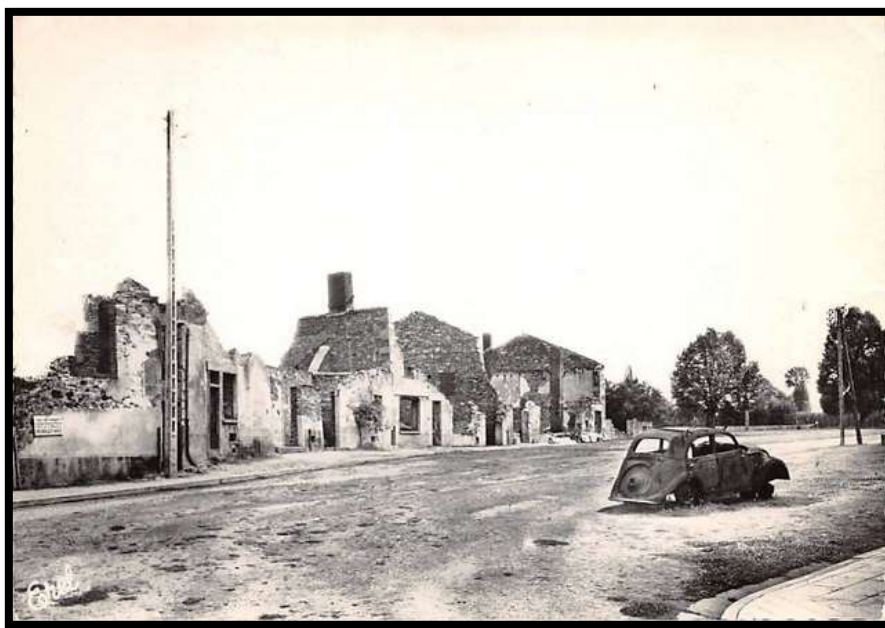
Place du Champ-de-Foire

Le 10/06/1944 , après l'arrivée des Allemands dans le bourg d'Oradour-sur-Glane , le garde champêtre fait savoir aux habitants qu'ils doivent tous se rassembler , sans aucune exception et sans délai , sur la place du Champ-de-Foire située à l'intérieur du village , munis de leurs papiers , pour une vérification d'identité .