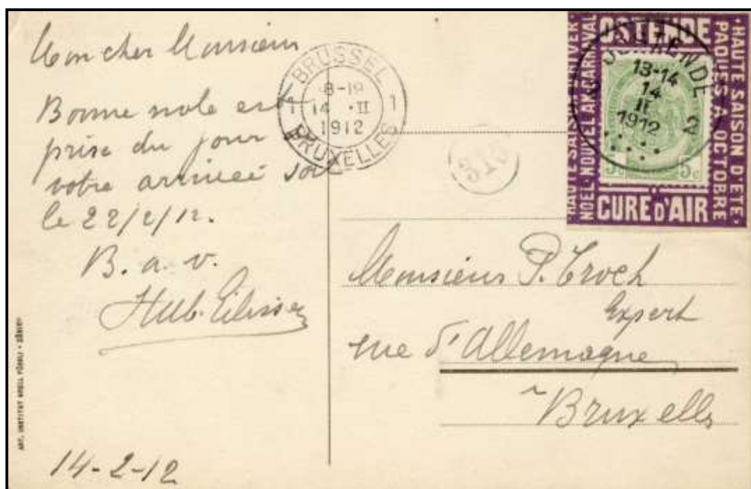
Carte postale d'Ostende vers Bruxelles le 14 février 1912